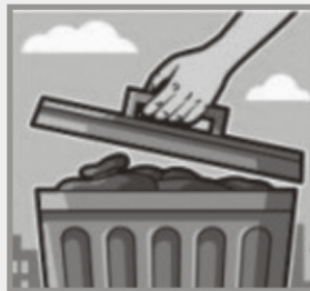
Mantenha a lixeira bem fechada