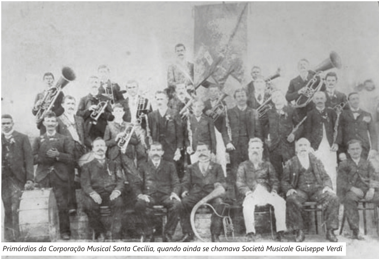
Primórdios da Corporação Musical Santa Cecília, quando ainda se chamava Società Musicale Guiseppe Verdi

Depois das inesquecíveis apresentações da escola de samba Estação Primeira Mogiana, no carnaval. A Prefeitura anuncia o retorno de dois grandes patrimônios de Monte Alegre do Sul: a centenária Corporação Musical Santa Cecília, que fara quase 30 apresentações em 2017, e a