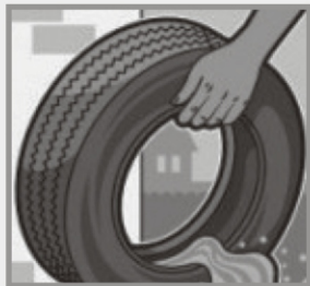
Retire a água dos pneus