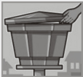
Mantenha caixas d'água fechadas

Você já sabe, mas não custa lembrar: O COMBATE AO Aedes Aegypti COMEÇA EM CASA!