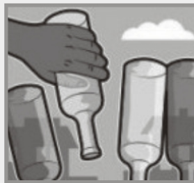
Deixe garrafas sempre viradas