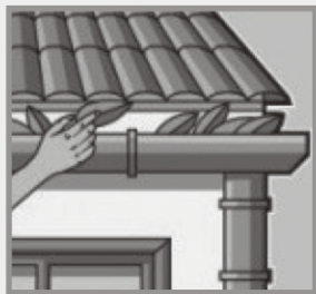
Limpe periodicamente as calhas