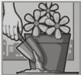
Coloque areia nos vasos de plantas