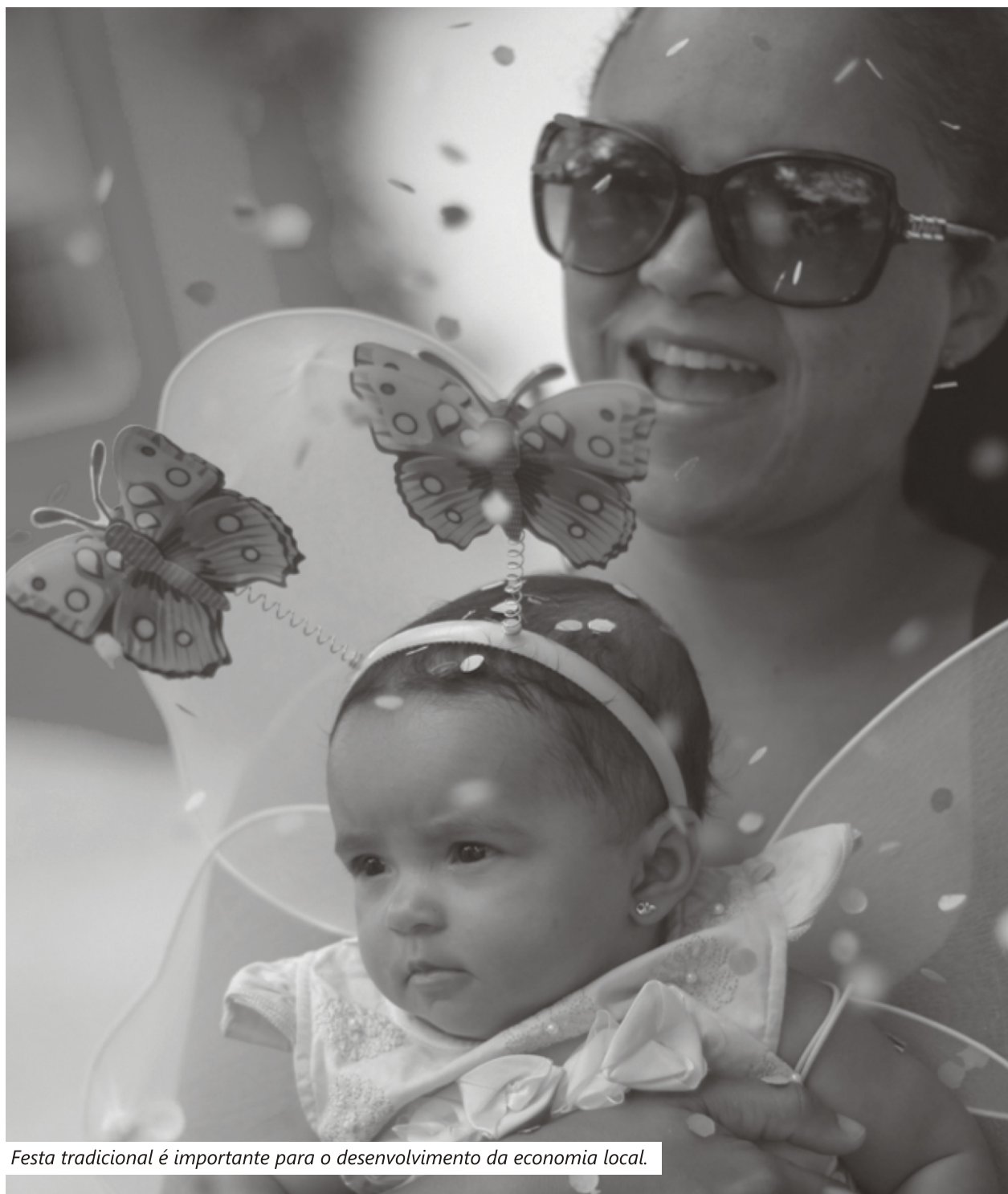
Festa tradicional é importante para o desenvolvimento da economia local.

Equipe da Prefeitura realiza melhoria na Estação de Tratamento de Água e intervém em pontos críticos das estradas municipais _____ PG 03