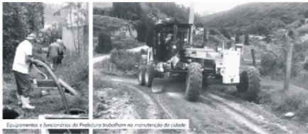
Equipamentos e funcionários da Prefeitura trabalham na manutenção do balneário.

Em poucos dias, muito trabalho por MONTE ALEGRE DO SUL