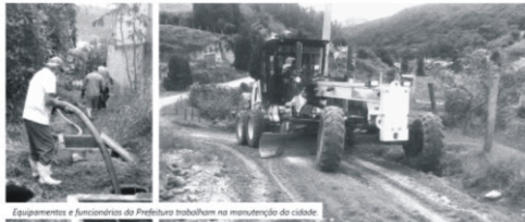
Equipamentos e funcionários da Prefeitura trabalham na manutenção da cidade.

Em poucos dias, muito trabalho por MONTE ALEGRE DO SUL