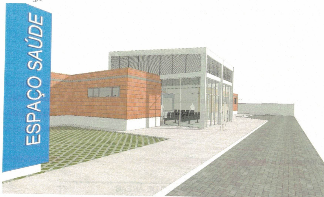
Figura 02 – Perspectiva