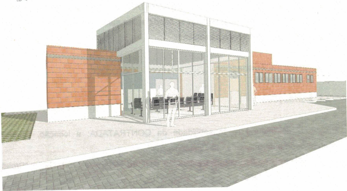
Figura 04 – Perspectiva