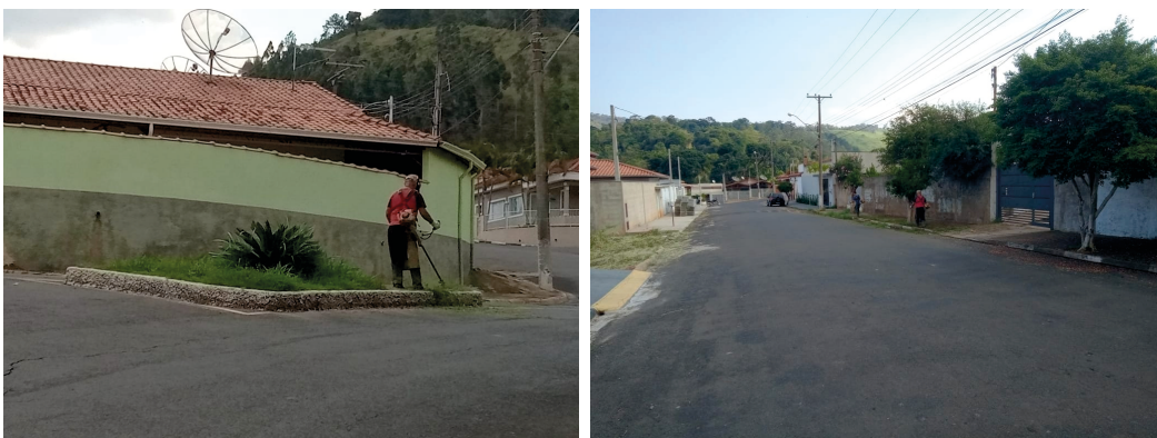
LIMPEZA DOS BAIRROS MENINO JESUS E JD.VITORIA.