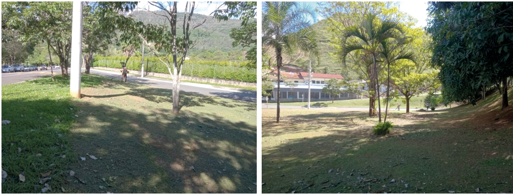
LIMPEZA E ROÇAGEM DAS ROTATÓRIAS ENTRADA DA CIDADE