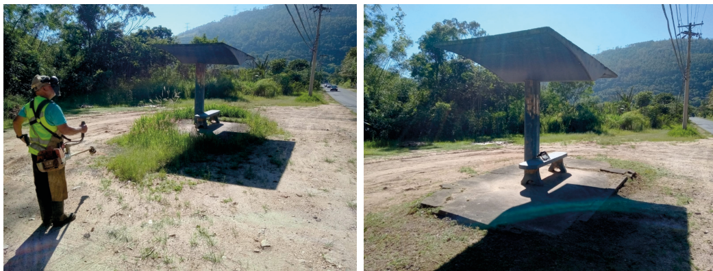
INÍCIO DE LIMPEZA NO SÃO GERÔNIMO, LIMPEZA E ROÇAGEM NOS PONTOS DE ÔNIBUS