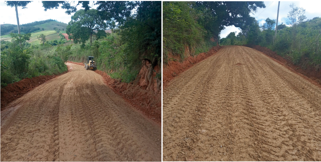
MANUTENÇÃO E CASCALHAMENTO ESTRADAS RIBEIRÃO DOS LIMAS