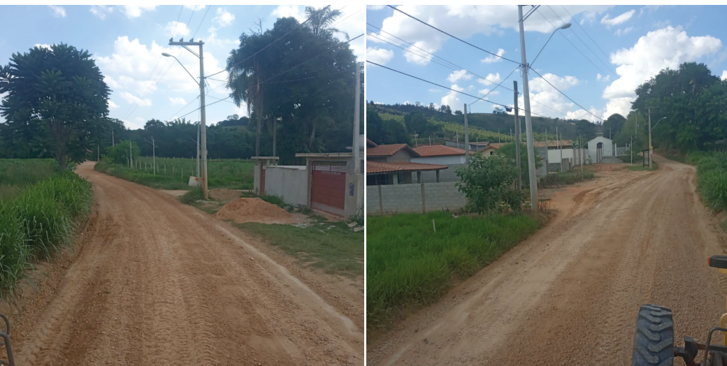
MANUTENÇÃO ESTRADA MOSTARDAS PARA SOCORRO