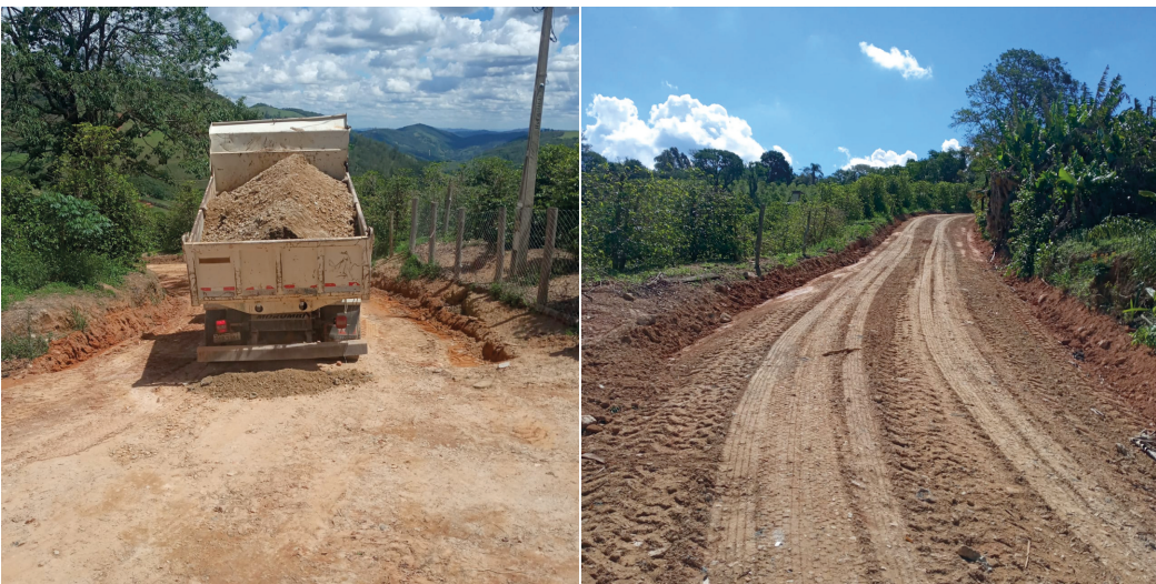
MANUTENÇÃO DA ESTRADA DO BRAZINHO - MORRO FAZENDA SANTANA