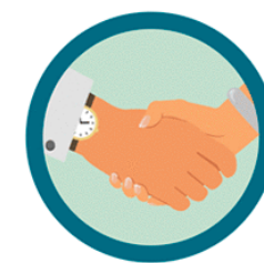
CONTATO FÍSICO COM PESSOA INFECTADA