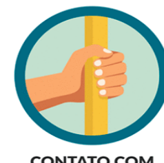
CONTATO COM SUPERFÍCIES CONTAMINADAS Seguido de contato com boca, nariz e olhos.