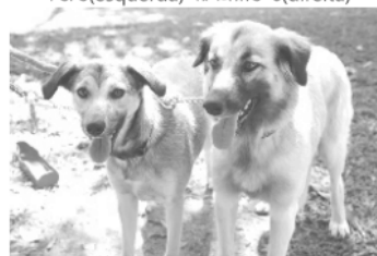
Fifi (esquerda) Mami's (direita)

Para adoção conjunta responsável Fifi: fêmea, aprox. 1 ano, médio porte (15k) Mami's: fêmea aprox. 2 anos, médio porte (25k) Vacinas, vermifugadas e castradas.