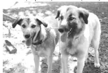
Fifi (esquerda) Mami's (direita)

Para adoção conjunta responsável Fifi : fêmea, aprox. 1 ano, médio porte (15k) Mami's : fêmea aprox. 2 anos, médio porte (25k) Vacinas, vermifugadas e castradas.